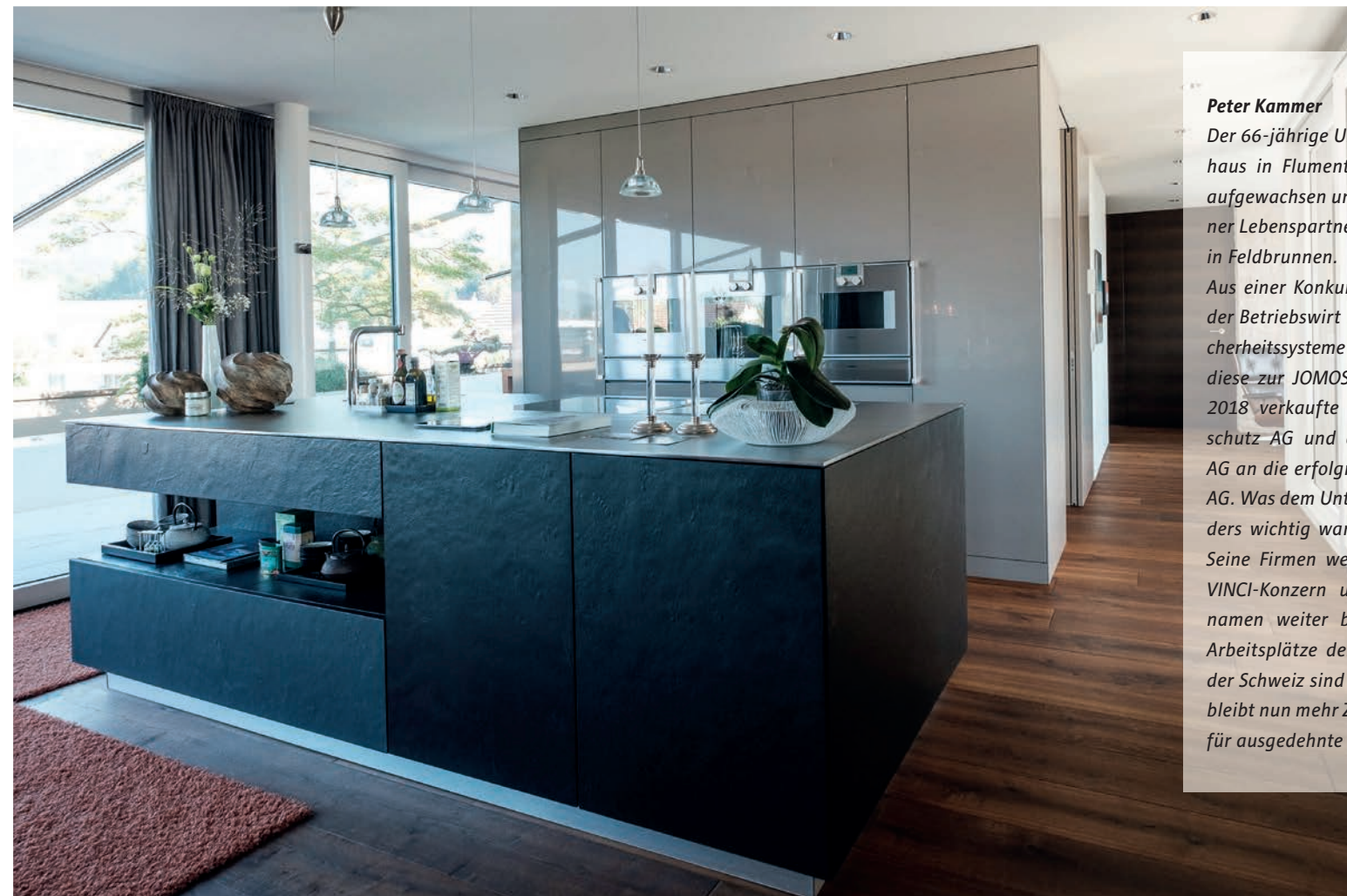
Feng-Shui bis ins kleinste Detail: Harmonie durch Materialisierung und Farbgebung