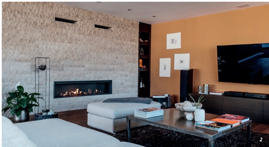
1. Aus zwei mach eins: Peter Kammer's Loftwohnung erstreckt sich über die 1. und 2. Etage 2. Feng-Shui und ein Flair fürs Einrichten: Das grosszügige Wohnzimmer