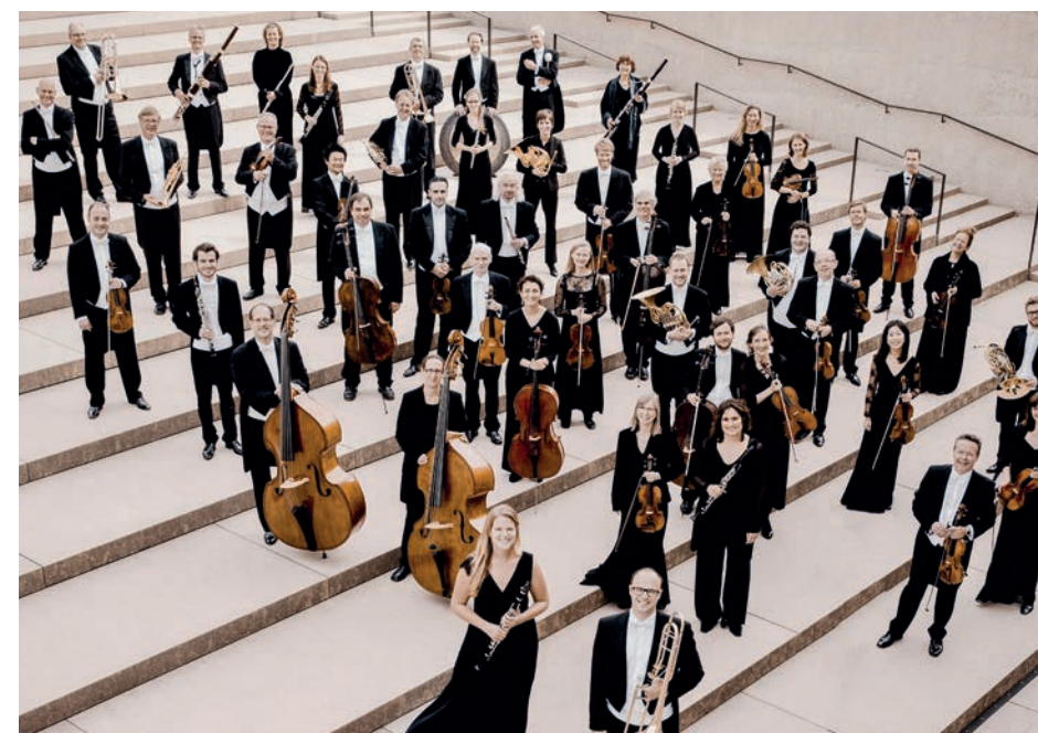
Zum Auftakt der Classionata zeigt das Orchester Münchner Symphoniker eine Auswahl ihres grossen Repertoires.