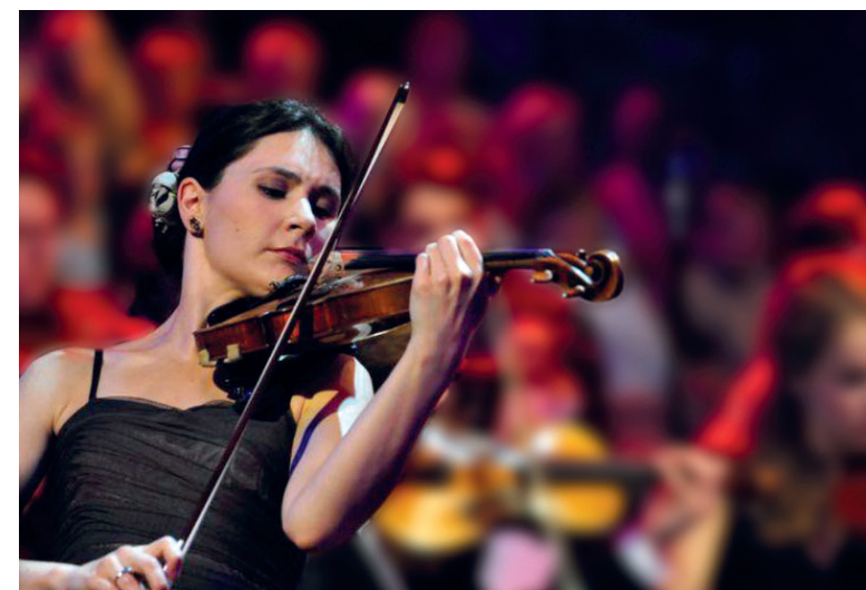
Die französische Geigerin Fanny Clamagirand gilt als eine der besten Violinistinnen ihrer Generation.