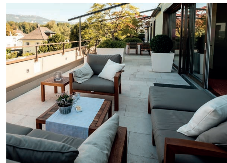
Der Dachgarten ist in drei Bereiche gegliedert. Als Raumteiler dienen Bäume und Sträucher in mächtigen Töpfen

PK: Ja, die gibt es. In Solothurn haben wir die Möglichkeit, neue Mitglieder für den Gönnerverein und auch neue Sponsoren zu gewinnen. Zudem bietet die charmante Stadt Solothurn hervorragende Voraussetzungen für das uns wichtige Hospitality-Angebot. >>