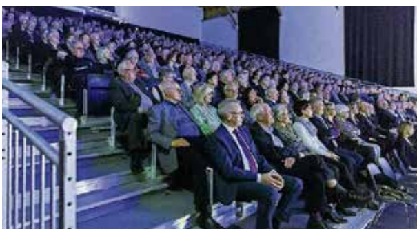
Die Reithalle ist fast bis auf den letzten Platz besetzt.

«Die Fledermaus» Nächste Aufführungen: Do 4., Sa 6., So 7. April.